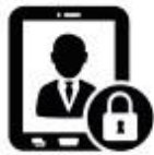
Data Protection Officer

Tra questi troviamo il Data Protection Officer , un professionista che combina competenze giuridiche, informatiche ed analitiche, con il compito di proteggere i dati personali e di implementare le azioni necessarie per assicurarne la massima sicurezza. Un'altra figura, già esistente ma con nuove funzionalità, è il Chief Information Security Office che si occupa di definire una strategia aziendale volta alla minimizzazione dei rischi per i dati sensibili. Infine abbiamo il Blockchain Expert , un esperto informatico specializzato nella scrittura di protocolli che permettono una maggiore sicurezza nello scambio di informazioni e dati, quali ad esempio contratti e transazioni finanziarie.