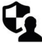
Chief Information Security Office